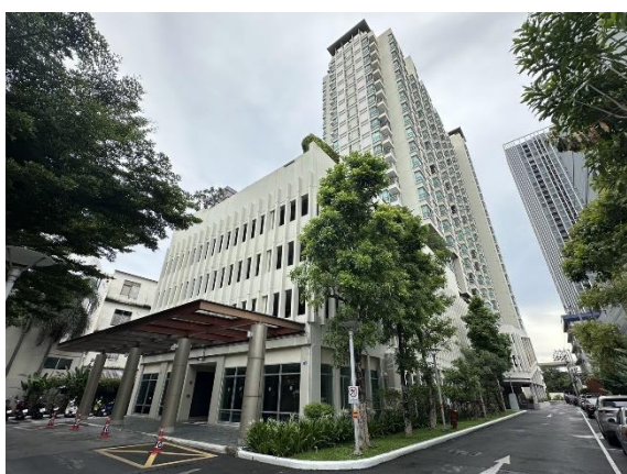
รูปที่ 1.4-1 แสดงสถานภาพปัจจุบันของโครงการ (ช่วงเดือนมกราคม-มิถุนายน 2568)